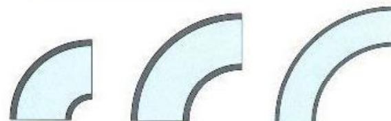
courbes 2D ou CR courbes 3D ou LR courbes 5D